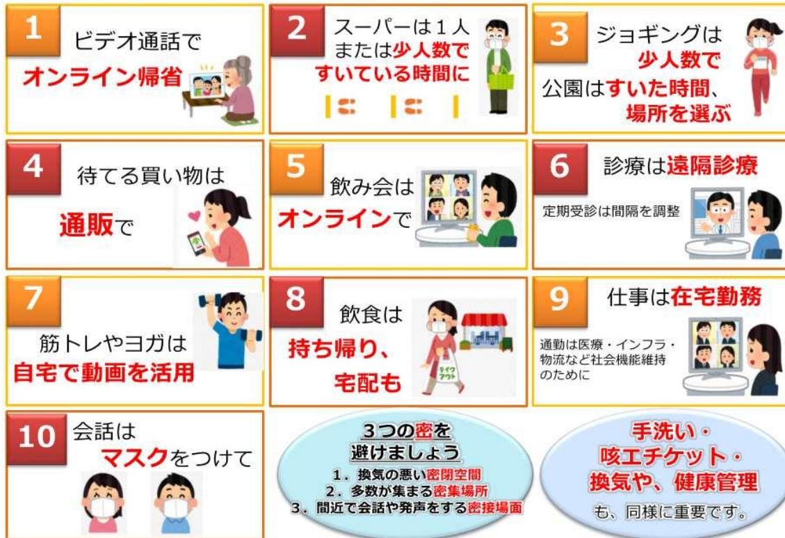
図1 人との接触を8割減らす、10のポイント（厚生労働省のウェブサイトより一部抜粋）

緊急事態宣言の中、誰もが感染するリスク、誰でも感染させるリスクがあります。 新型コロナウイルス感染症から、あなたと身近な人の命を守るよう、日常生活を見直してみましょう。