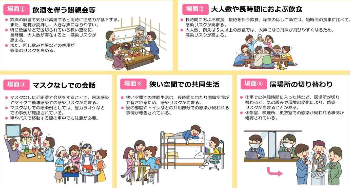
図2 感染リスクが高まる「5つの場面」（内閣官房のウェブサイトより一部抜粋）